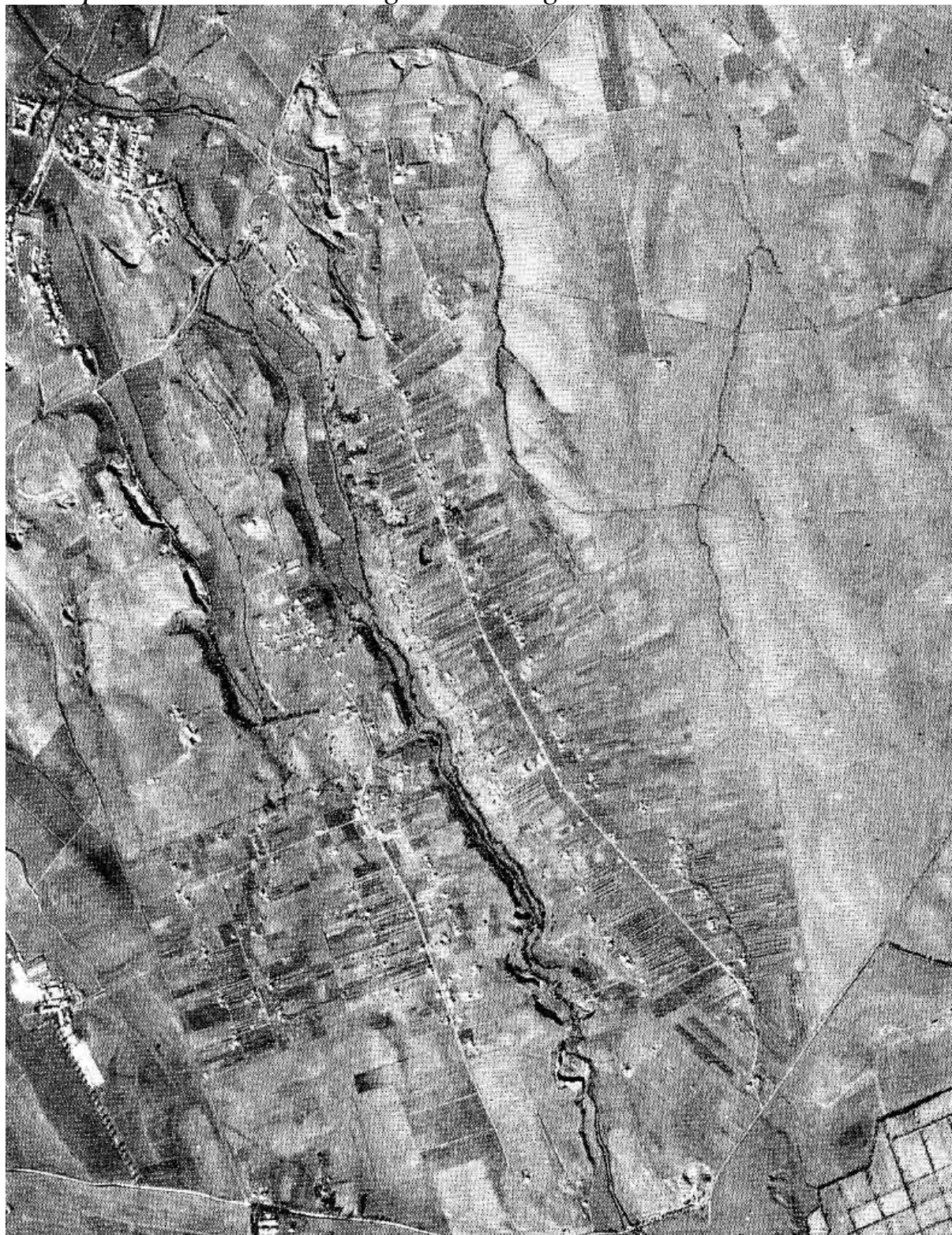
Foto Aerea dei primi anni '50 – zona Castellaccio Ovile dalla Via Prenestina a Lunghezza

La copertura invece era eseguita con tegole e catinelle a secco.