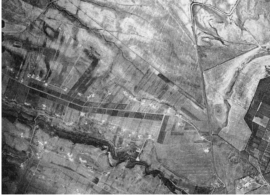
Foto Aerea dei primi anni '50 – Castellaccio lato Via Prenestina Si notano i campi arati, le prime case e la strada Via Massa di S. Giuliano

Per poche centinaia di lire lavoravamo duramente nelle tenute agricole e ricordo che la paga giornaliera era oscillante dalle seicento alle settecento lire al giorno